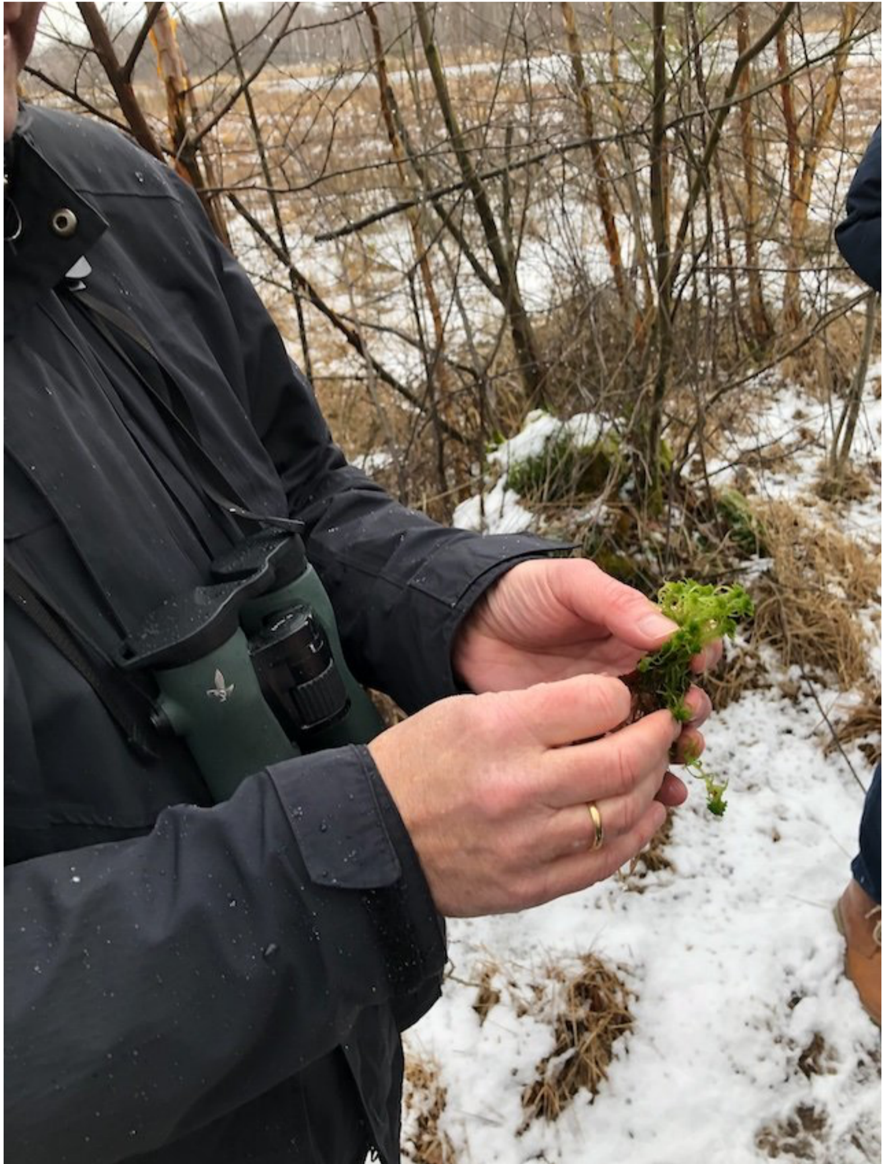
Ohne diese kleine Pflanze, das Torfmoos, gäbe es kein Torf.

Die Vereinsmitglieder, insbesondere Versicherer und Finanzdienstleister wie Vertriebe und Makler, sollen an Projekten zum Klimaschutz teilhaben können.